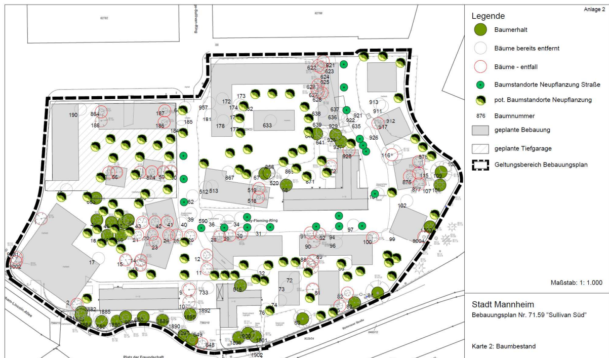
Abb: Karte Baumerhalt, Quelle: Grünordnungsplan zum B-Plan Sullivan Süd

Im Plangebiet unterliegen rd. 90 Bäume der Baumschutzsatzung. Im B-Plan sollen lediglich 30 Bäume zur Erhaltung festgesetzt werden. Dafür sollen 98 Bäume nachgepflanzt werden.