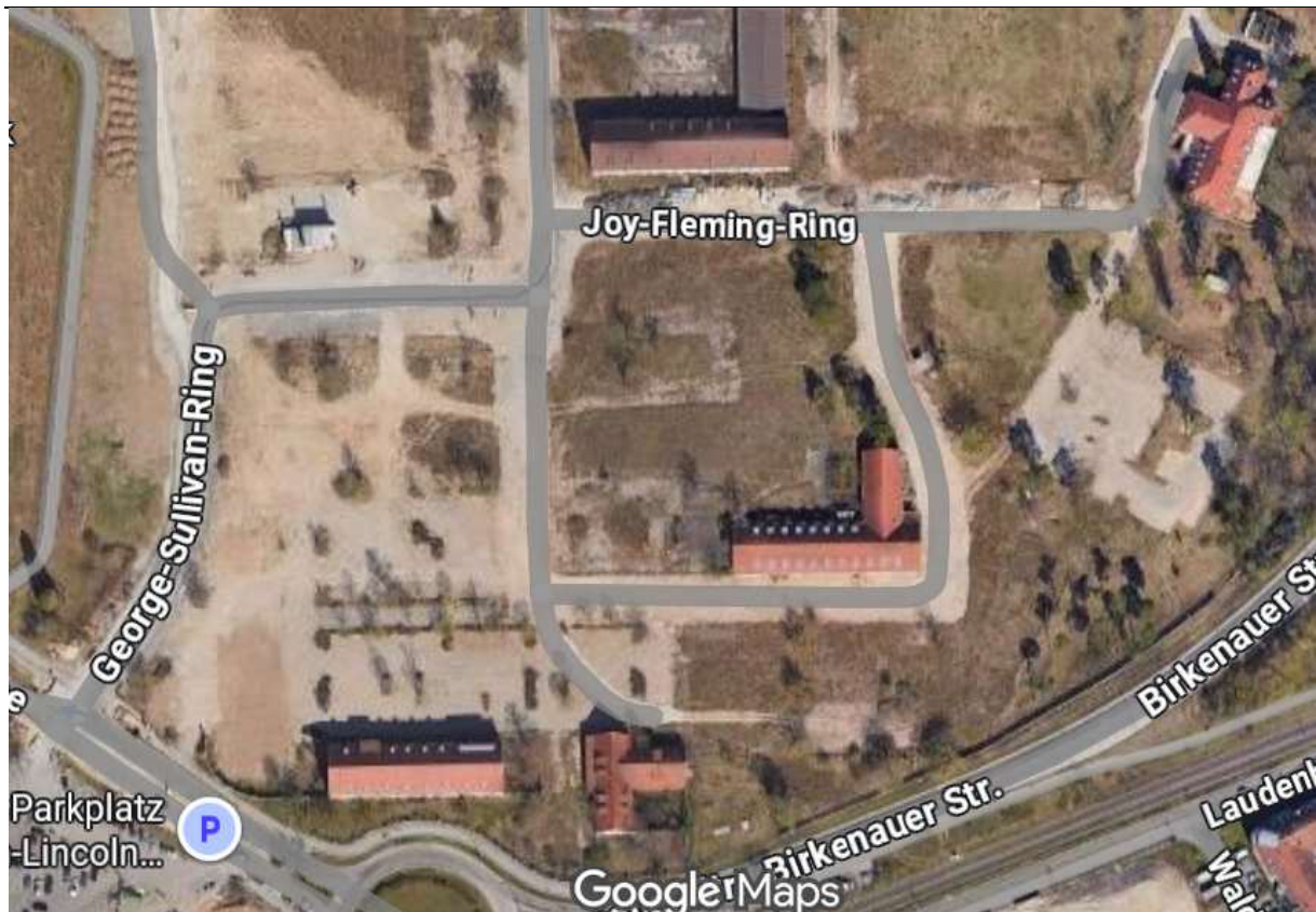
Abb: Ausschnitt aus Google Maps

Wir begrüßen den angestrebten KfW-40-Standard. Dieser ist jedoch nicht in den B-Plan-Vorgaben aufgeführt. Es wird lediglich in den nachrichtlichen Übernahmen /Hinweisen unter Nr. 16 auf den KfW 55-Standard als „Soll-Vorgabe“ hingewiesen. Wir bitten darum, dies anzupassen.