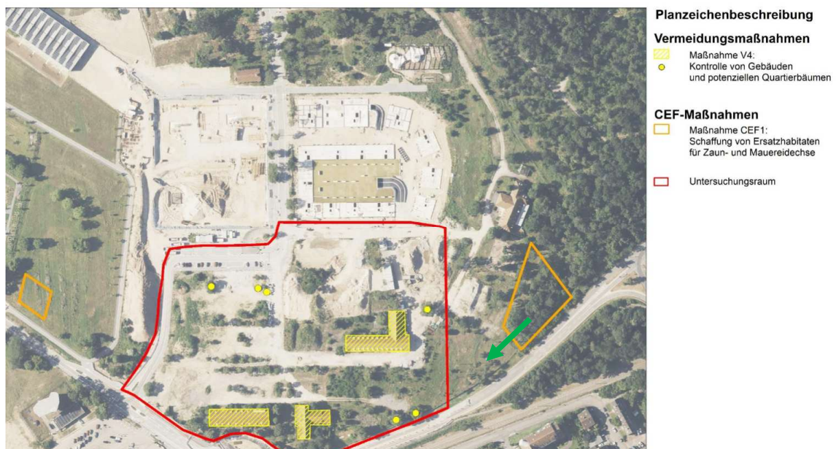
Abb: Artenschutzmaßnahmen, Auszug aus dem Artenschutzgutachten, mit Markierung Vorschlag für eine ggf. notwendigen Verschiebung der CEF-Maßnahme (grüner Pfeil)

Die CEF1-Maßnahme: „Schaffung von Ersatzmaßnahmen für Zaun- und Mauereidechsen“ östlich des B-Plans (für Zauneidechse) liegt im baumbestandenen Bereich in einem Kiefernain. Hier sollten keinesfalls Bäume für die CEF-Maßnahme gefällt werden. Wir bitten darum, die Lage zu überprüfen und ggf. weiter nach Südwesten auf die Freiflächen zwischen B-Plan und Waldgebiet zu verschieben. Dies liegt auch näher an den bisherigen Fundorten der Zauneidechse.