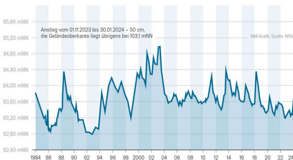
Abbildung: Veränderung des Grundwasserspiegels im Jahresverlauf, Quelle: Mannheimer Morgen, 17.02.2024: Nasser Herbst und Winter: So steht es um das Grundwasser rund um Mannheim