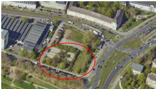
Abb: Frühere Begrünung des Areals Schafweide

Auf älteren Luftbildern zeigt sich die umfangreiche Begrünung des gesamten Areals (siehe folgende Abbildung)