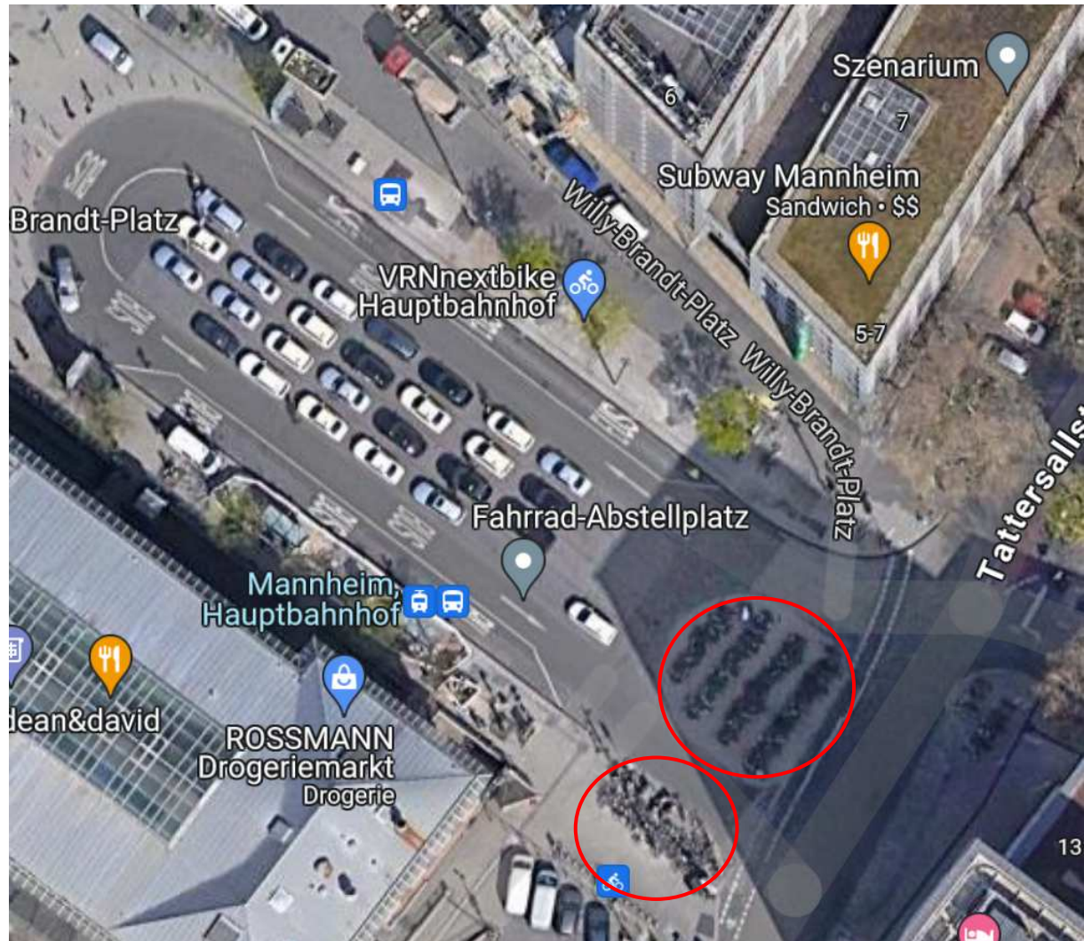
Abb: Ausschnitt aus Google Maps, aktuelle Situation Fahrradabstellanlagen

In den Planungen sind keine Fahrradstellplätze vorgesehen. Bisher gibt es am östlichen und südöstlichen Rand des Geländes zahlreiche Fahrradabstellplätze, die komplett wegfallen sollen. In Mannheim ist die Förderung des Radverkehrs Teil des KSAP 2030. Dazu gehört auch das ausreichende Angebot an Fahrradabstellanlagen, insbesondere an wichtigen Knotenpunkten. Trotz der Schaffung neuer Fahrradabstellanlagen auf dem Willy-Brandt-Platz sind diese stets gut belegt, was den Bedarf an Fahrradabstellanlagen zeigt und ungeordnetes Fahrradparken vermindert. Wir bitten hier um Nachbesserung und schlagen vor, ggf. auf Grüninsel Nr. 9 und 10 zu verzichten und bzw. stattdessen eine weitere Grüninsel z.B. westlich auf dem Bahnhofsvorplatz (hinter der Abpollerung) anzulegen. Dort ist bisher nur eine große gepflasterte Fläche ohne Begrünung geplant.