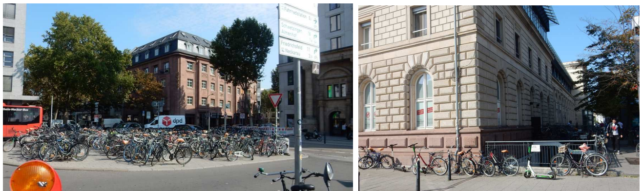
Abb links: Fahrradabstellanlage am südöstlichen Ende des Taxistandes, rechts: Ungeordnetes Parken