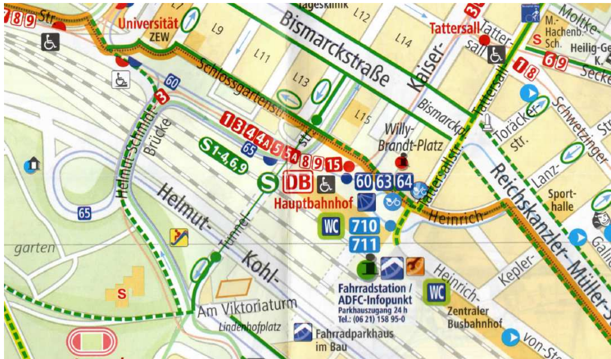
Abb: Ausschnitt aus dem Mannheimer Bürgerstadtplan.

Außerdem weisen wir darauf hin, dass auf dem nördlichen Bahnhofvorplatz eine Radverkehrsachse von der Heinrich-Lanz-Straße bzw. Tattersallstraße bis zur Schlosstraße entlangführt. Diese ist auch im Mannheimer Bürgerstadtplan eingezeichnet (siehe folgende Abbildung, grüne durchgehende und gestrichelte Linie). Wir vermissen jedoch eine entsprechende Berücksichtigung in den Planungen.