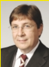
Lothar Quast Dezernent für Planung, Bauen, Umweltschutz und Stadtentwicklung

Mein Dank gilt dem Umweltforum, der städtischen Verkehrsplanung sowie allen Beteiligten, die das Projekt unterstützt haben.